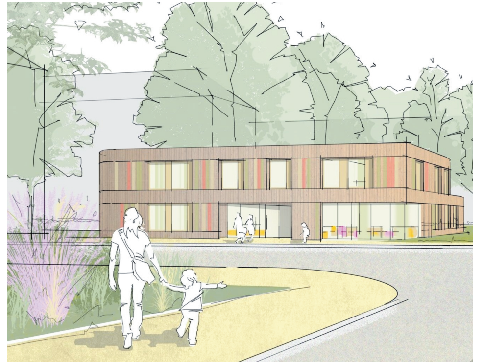
Visualisierung viergruppiges Kinderhaus Lindenhof

Das Architekturbüro Blocher Partners hat die Kindertagesstätte als innovativen Holzbau mit KfW 40 Standard und DGNB-Zertifizierung entworfen. Der zweigeschossige Neubau mit rund 975 Quadratmetern Gesamtfläche wird L-förmig entlang der Waldpark- und Landteilstraße platziert und öffnet sich in den bestehenden Park- und Außenraum, dessen Qualität durch den vorhandenen Baumbestand genutzt und als Frei- und