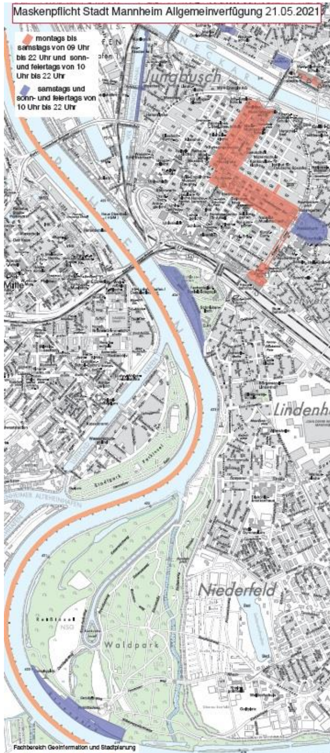
Lageplan Maskenpflicht vom 21.05.21