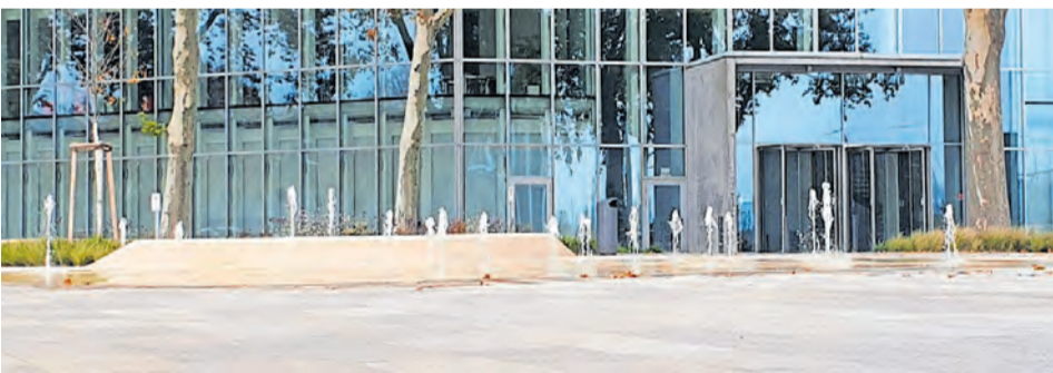
Das Fontänenfeld auf dem Lindenhofplatz