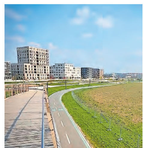
Blick auf die Wohnbebauung auf Spinelli