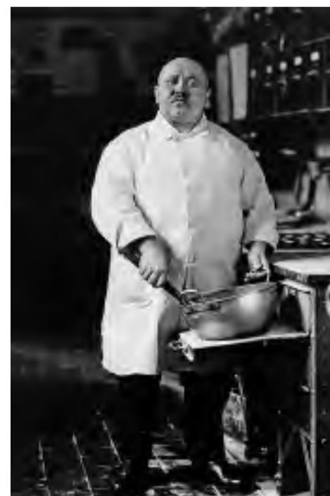
August Sander: Konditor, 1928 © Die Photographische Sammlung/SK Stiftung Kultur - August Sander Archiv, Köln; VG Bild-Kunst, Bonn, 2024

Entscheidend für das Lebensgefühl der Weimarer Republik war die Erfahrung des Ersten Weltkriegs. Auch die Kunstschaffenden waren auf der Suche nach neuen Inhalten und Ausdrucksmöglichkeiten. Die Abbildung der nüchternen und ungeschönten Wirklichkeit