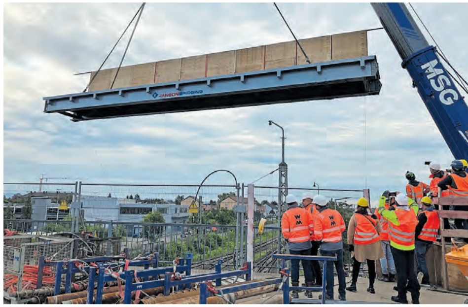
Die ersten Teile der Behelfsbrücke werden eingehoben.

Bei der auf mehrere Jahre angelegten Pla-