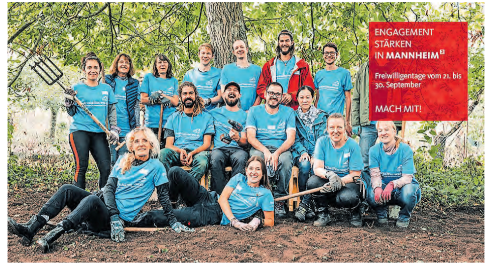
Die Freiwilligentage finden von 21. bis 30. September statt.

In einigen Projekten werden noch Helferinnen und Helfer gesucht. So wünschen sich zum Beispiel am 24. September Bewohner*innen des Karl-Weiß-Pflegeheims weitere Begleitpersonen für einen Ausflug in den Luisenpark, der schöne Erinnerungen wecken soll. Handwerkliche Hilfe ist am 21. September gefragt, wenn in der Kinderbetreuung Villa Asteria ein Klettergerüst aufgebaut werden soll. Und am 27. September kann