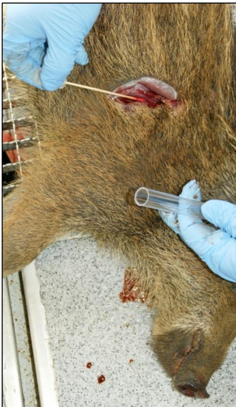
Abb. 4: Entnahme einer Tupferprobe

Um einen Seucheneintrag frühzeitig zu erkennen, ist die Beprobung tot aufgefundener Stücke und krank erlegter Tiere besonders wichtig. Diese sog. Indikatortiere müssen immer beprobt werden.