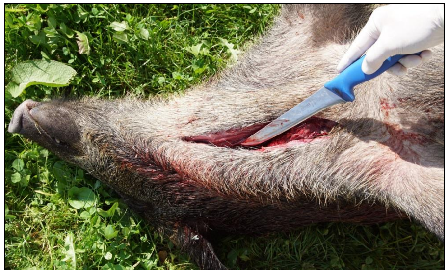
Abb. 2: Eröffnung der Halsvene mittels Längsschnitt zur Blutprobenentnahme