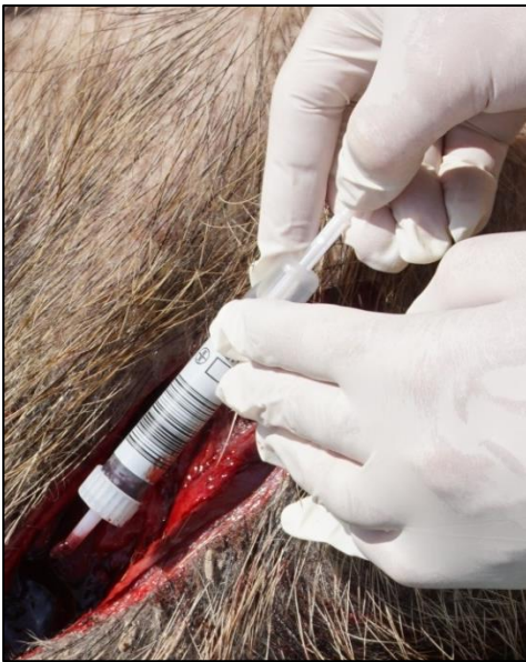
Abb. 3: Entnahme einer Serumprobe