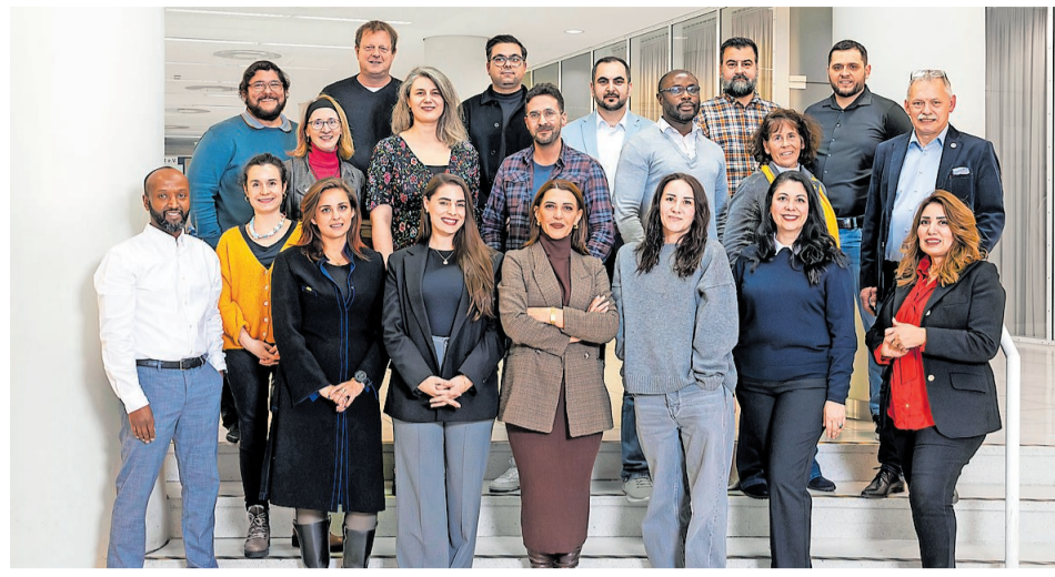
Der neue Migrationsbeirat 2025-2029.