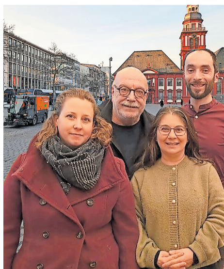
LTK setzt sich für Sauberkeit und Umweltschutz ein.