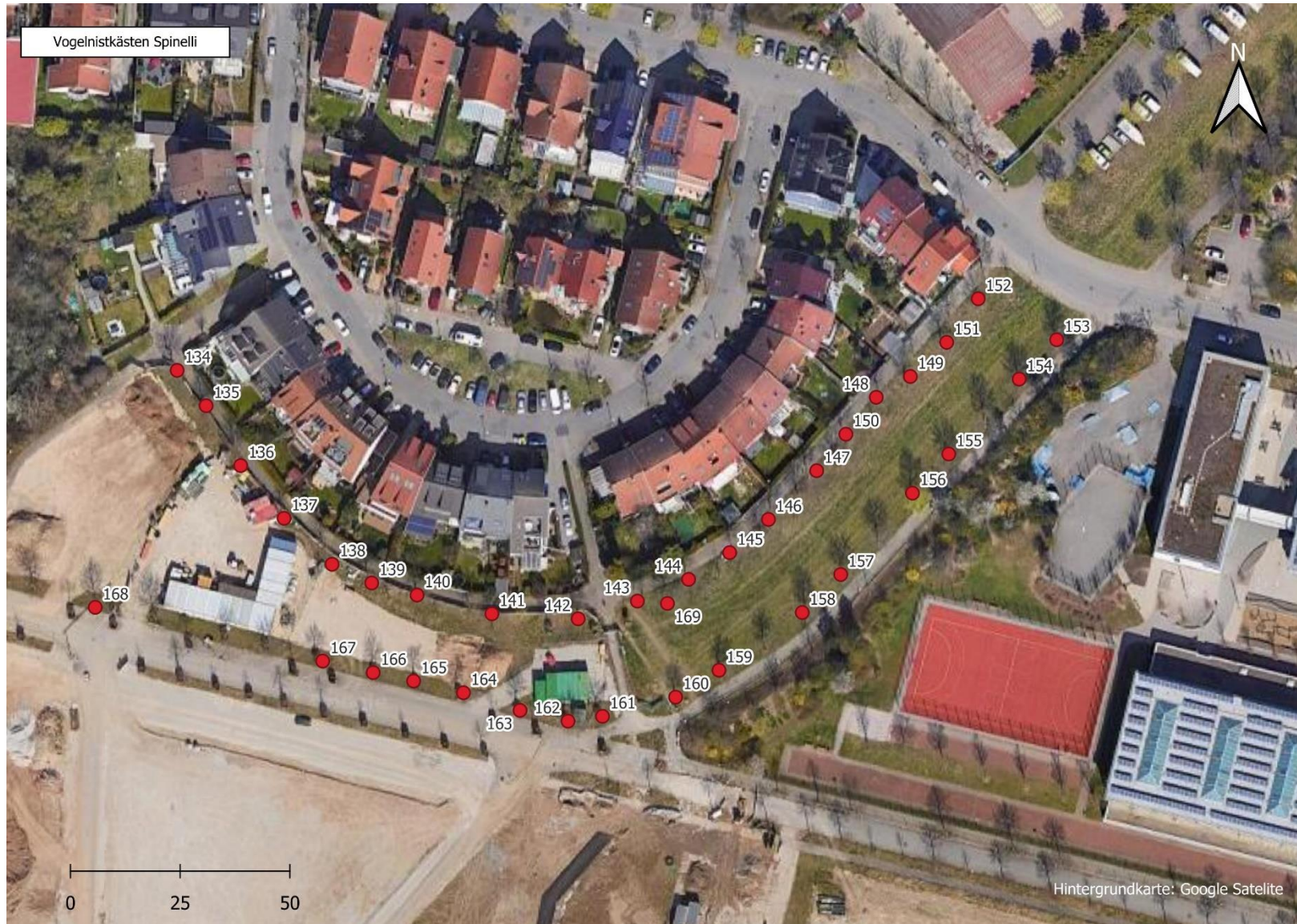
Abbildung 2: Lage der bereits aufgehängten Nistkästen Nr. 1-36