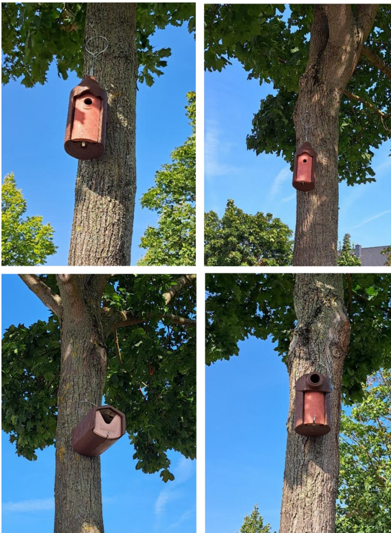
Abbildung 1: Verschiedene Kastentypen für Meisen, Stare und Halbhöhlenbrüter